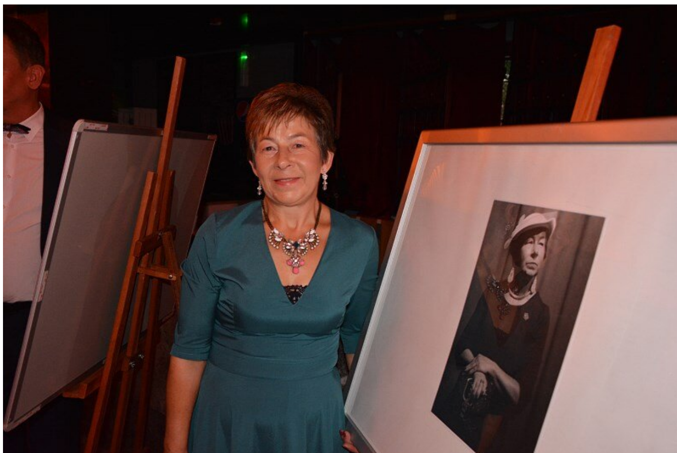
"Ale Gala" przyciągnęła tłumy. Było winno, czerwony dywan.