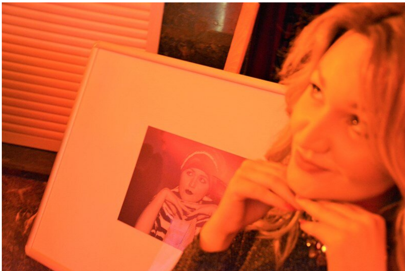
Modelami byli pracownicy CKŻ.