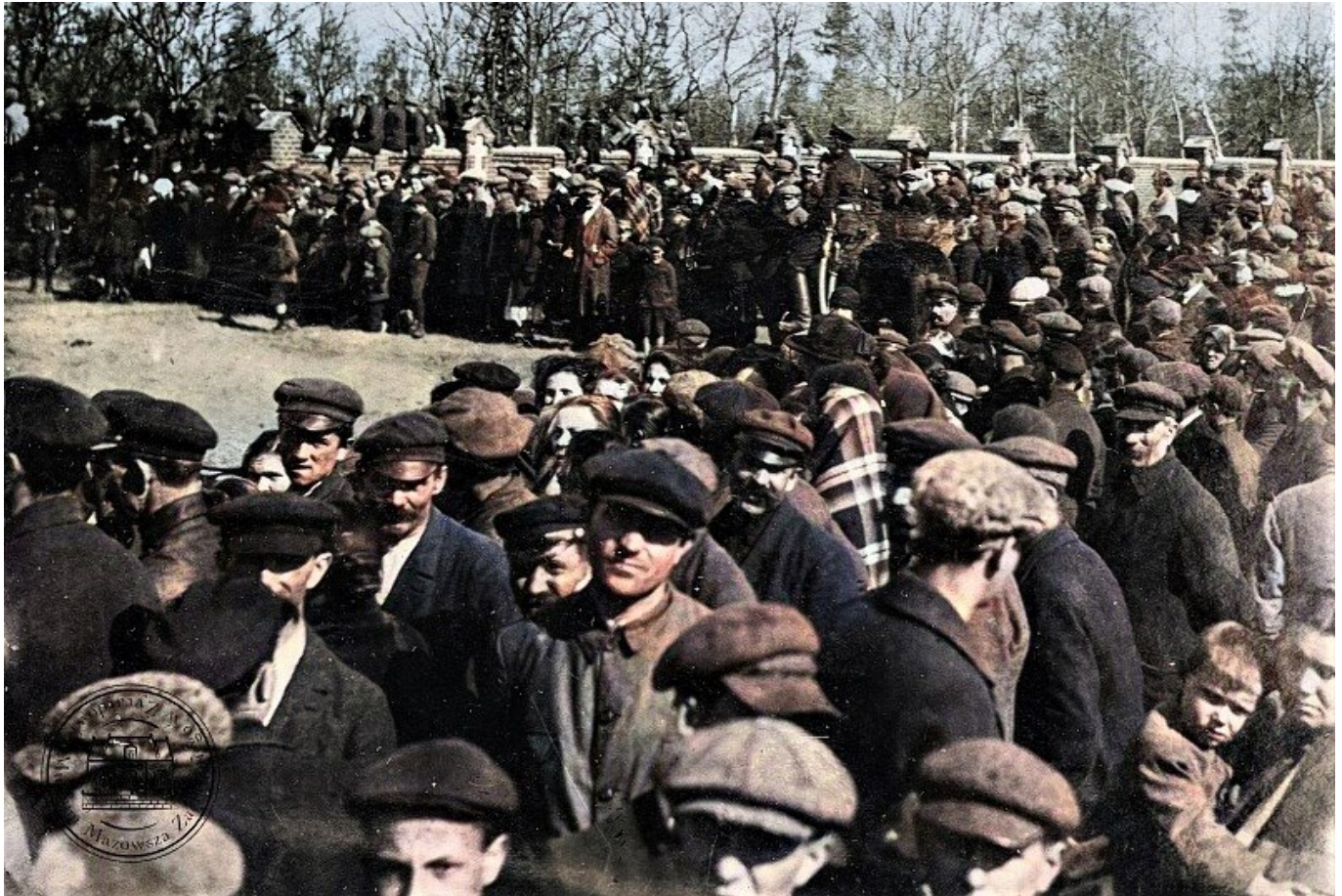
Tłum gapiów oglądający ostatni bój Krwawego Popielarza

data aktualizacji: 2020.05.11 autor: Redakcja