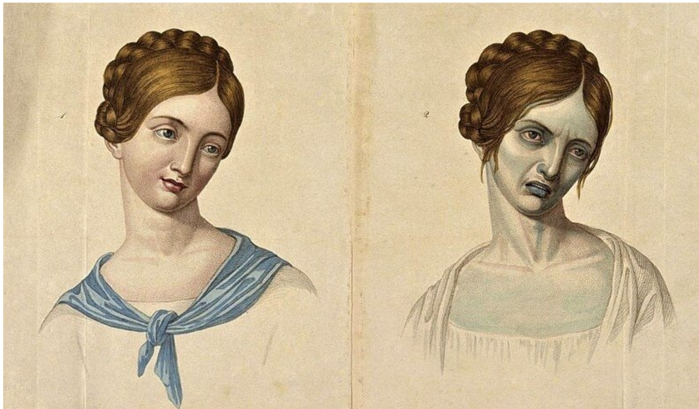
Rysunek przedstawiający zmiany zachodzące u 23-latki chorej na cholere.

data aktualizacji: 2020.05.18 autor: Redakcja