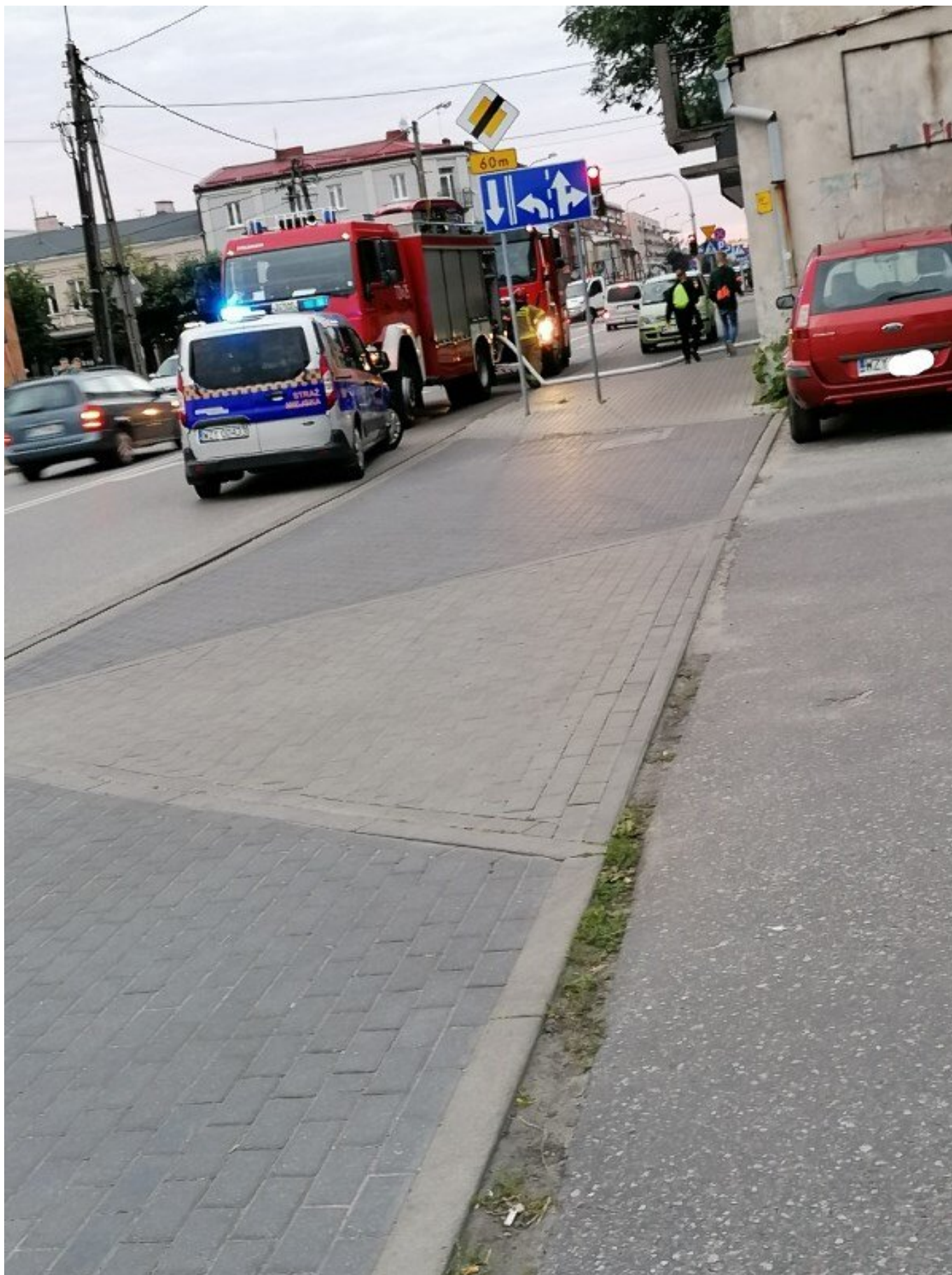
Zdaniem strażaków prawdopodobnie na skutek celowego podpalenia doszło do pożaru nieużytkowanych komórek przy ul. 1 Maja w Żyrardowie. Na tyłach „dawnego sądu”.