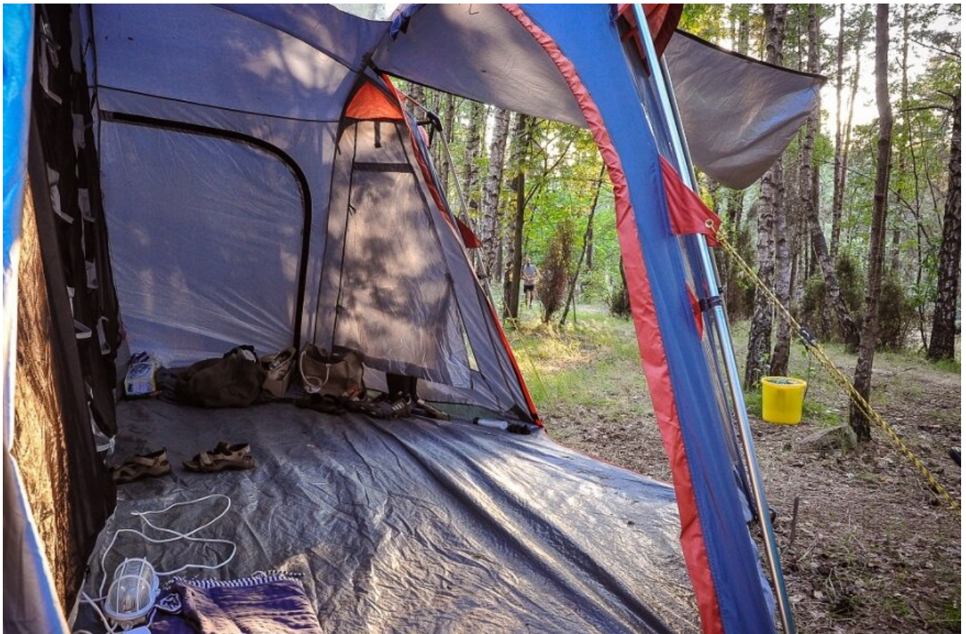
Hamaki są łatwe w użyciu, ale jeśli ktoś lubi mieć w lesie apartament...

data aktualizacji: 2021.04.30 autor: Sławomir Burzyński