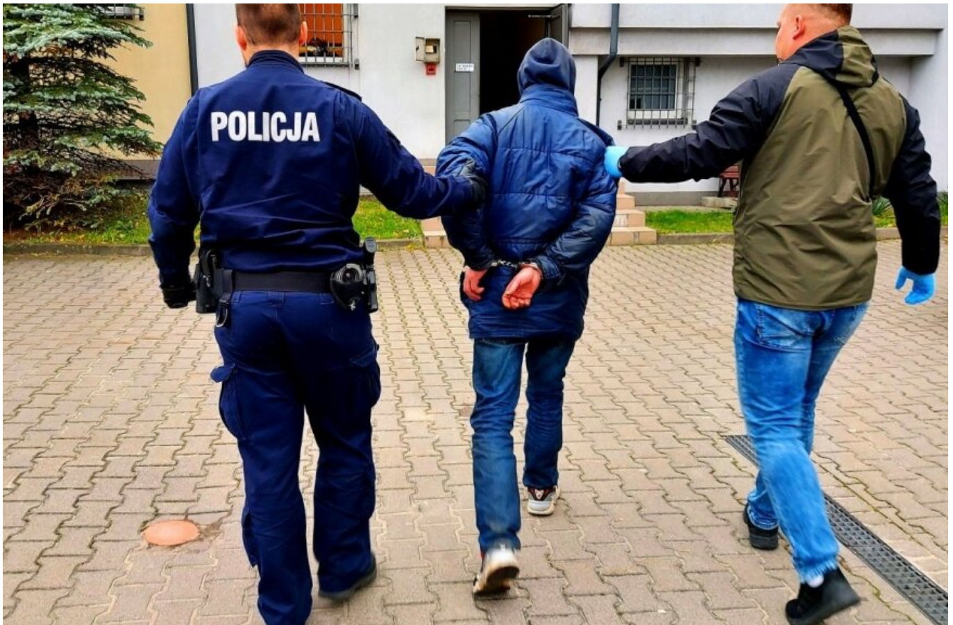
Rawscy policjanci zatrzymali dwóch mężczyzn w wieku 50 i 68 lat podejrzanych o kradzież

data aktualizacji: 2021.11.02 autor: Włodzimierz Szczepański