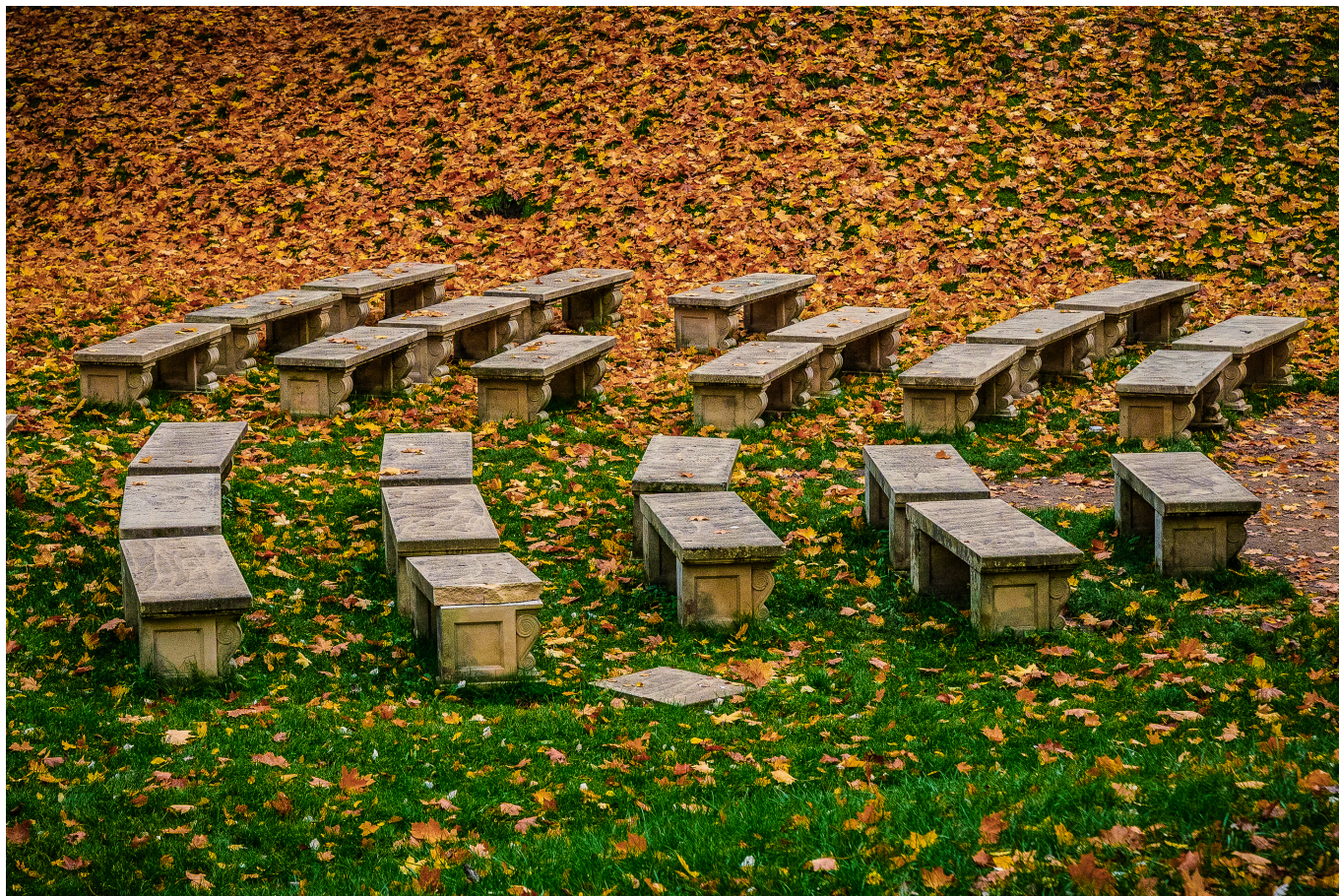
W promieniach niskiego słońca aleje wyglądają jak kadry z filmu Tarkowskiego. Nad Skierniewką unosi się poranna mgła, a w oddali słychać bicie dzwonów z kościoła św. Jakuba.